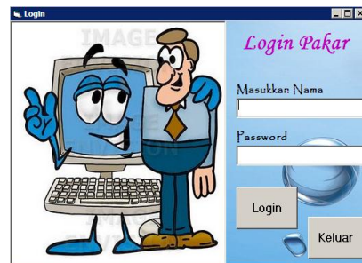
Gambar 2. Tampilan Login Pakar

Halaman ini merupakan tampilan form login untuk pakar