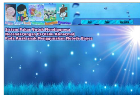
Gambar 3. Tampilan Menu Utama

Menu utama ini terdiri dari Admin, Pakar dan info sistem